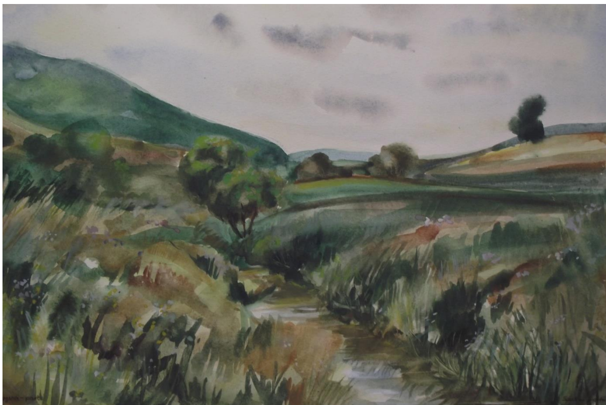
A Tarna patak völgye Siroknál.