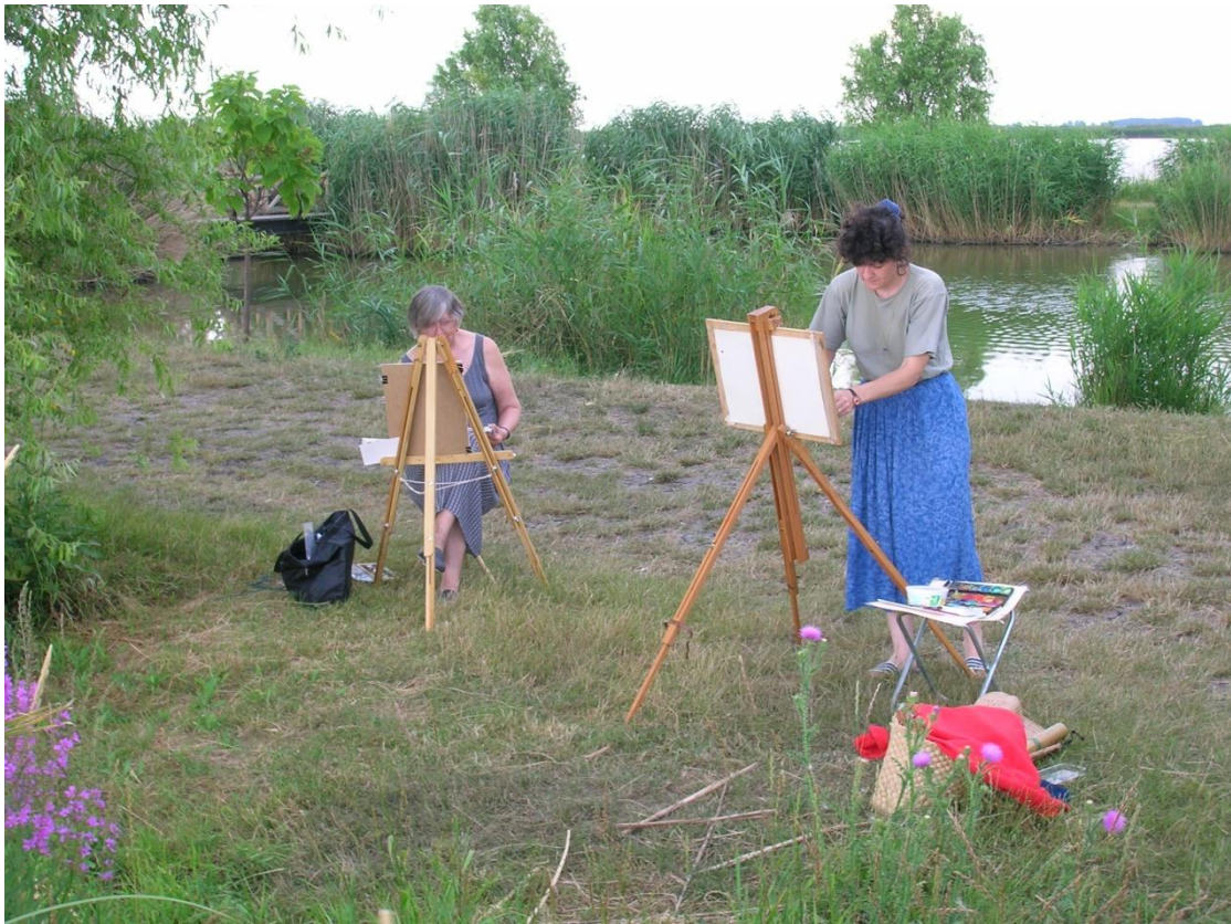
Őket én is megfestettem.