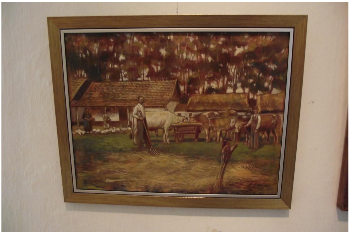
Tanyaudvar, - 1941.