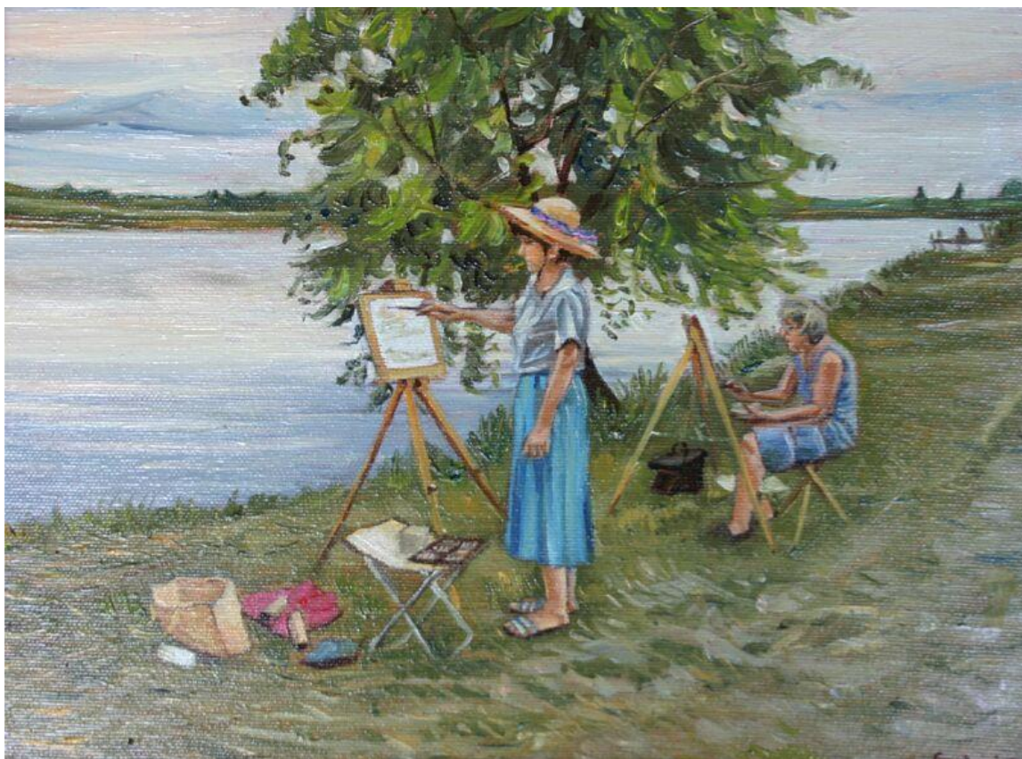
Festés a tanyán: