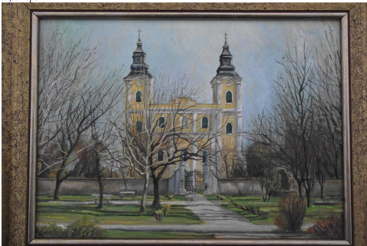
A jászapáti katolikus templom.